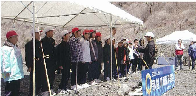
横見小学校校歌の斉唱

那賀川の上流域と下流域に位置する両校は、距離にして約100km離れていますが、北川小学校の児童たちからは、「今度は河口にも行ってみたい」といった声や、「那賀川を通じて遊べたらいいと思う」などの声も聞こえてきました。