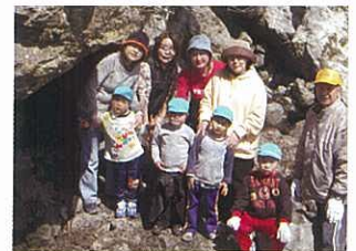
北川幼稚園の園児も参加しました。