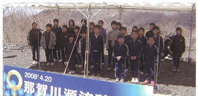
北川小学校校歌の斉唱