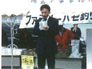
市長代理あいさつ