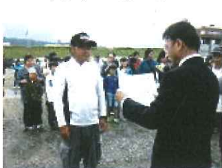
表彰式です。優勝されたみなさん