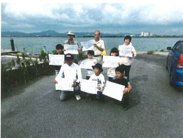
大会入賞のみなさん 同時開催で釣り教室も開催しました。