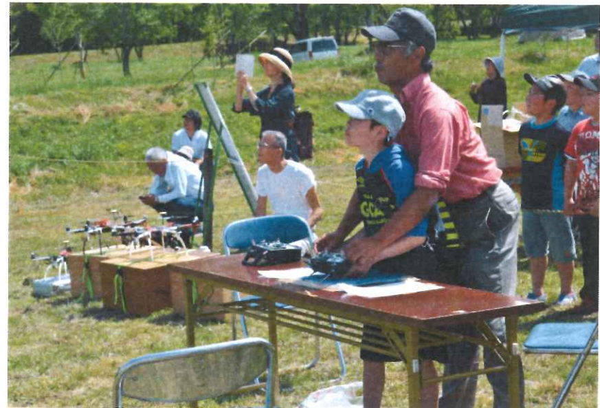
ドローン操作体験