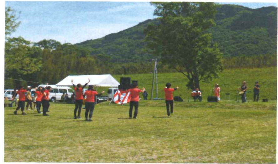
フォークコンサート