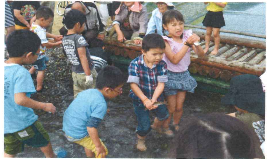
アメゴのつかみ取り