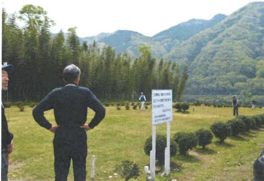
パークゴルフ大会