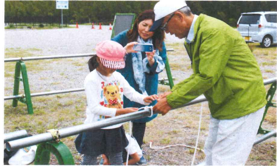
ロープワーク講習会