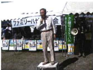
三井先生あいさつ