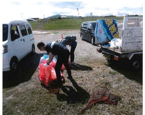
ゴミが帰ってきてます