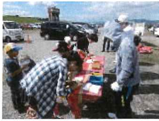
計量が忙しくなってきました