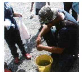
どれが大きいかな？