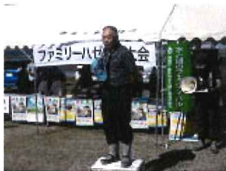
釣り具商組合よりあいさつ