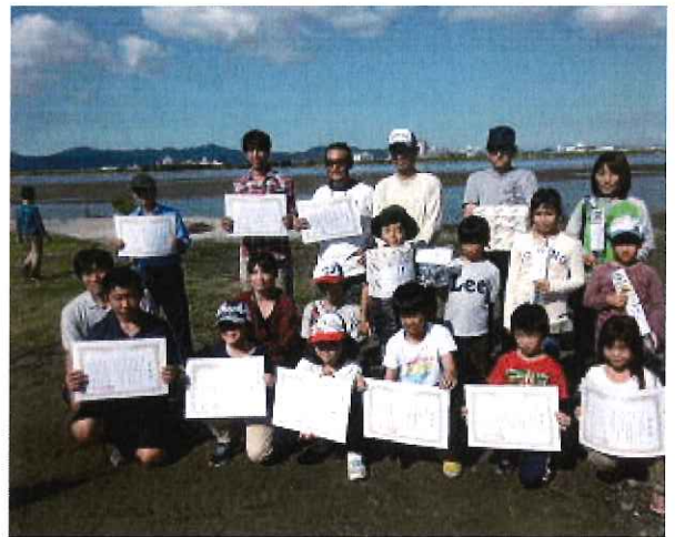
入賞されたみなさんです