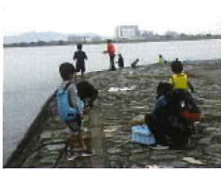
頑張ってください