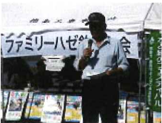
釣連盟 副委員長あいさつ