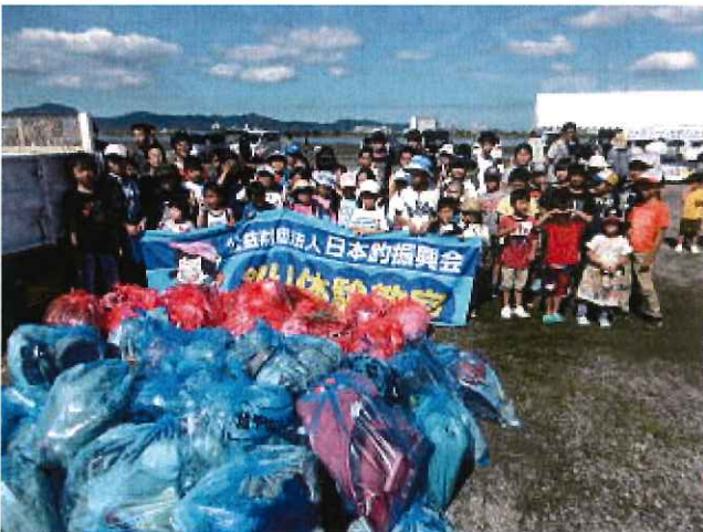
たくさんゴミも集まりました。