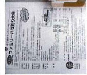
受付中です。放送局も来られて雰囲気が高まります。