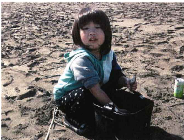
お魚見せてあげる～