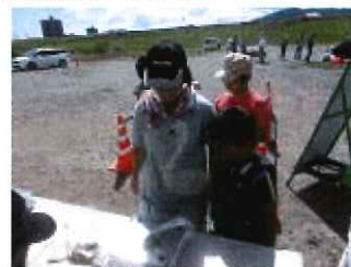
計量が始まりました