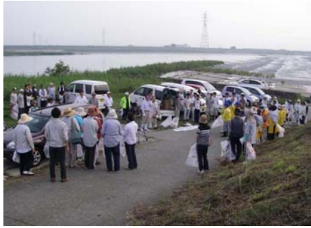
▲さあ！吉野川をきれいにしましょう。 ご協力ありがとうございました。

のアドプト団体や一般の方々が増し、早いところでは朝六時から清掃に取り掛かりました。今回の河川一斉清掃で収集されたゴミの量は、吉野川、那賀川で四トントラック三十一台分となりました。