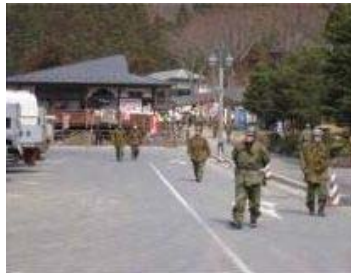
▲自衛隊の復旧支援活動の拠点として機能する道の駅「津山」

● 道の駅やインターチェンジと一体で整備された周辺施設が自衛隊の活動拠点や住民の避難場所、水、食糧、トイレを提供する重要な防災拠点としての機能を発揮しました。 自家発電設備を備える駅では、二十四時間体制で対応しました。