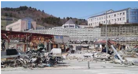
▲高台に建設された「女川町立病院」

● 道の駅やインターチェンジと一体で整備された周辺施設が自衛隊の活動拠点や住民の避難場所、水、食糧、トイレを提供する重要な防災拠点としての機能を発揮しました。 自家発電設備を備える駅では、二十四時間体制で対応しました。