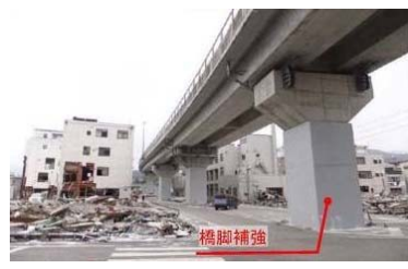
▲耐震補強済みの橋脚