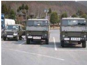
▲「道の駅」を自衛隊の活動拠点として活用

● 巨大津波に対して、防波堤や防潮堤などが被害軽減に一定の効果を発揮します。 太田名部地区防潮堤が津波に對して決壊せず、上流にある集落への津波被害を抑えました。