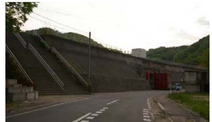
▲上流にある集落への津波被害を防いだ太田名部地区防潮堤

● 高台に設けられた学校や病院などの重要施設は被害を免れ、避難所としても機能しました。 高台(十六メートル)に建設された「女川町立病院」は、一階まで津波が押し寄せたものの、大きな被害は免れ、避難所として機能しました。