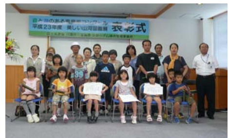
▲受賞者みんなで記念撮影 入選おめでとうございます。

記念撮影後、希望された児童・保護者の方に、普段は入ることの出来ない早明浦ダムの堤体内を見学していただきました。