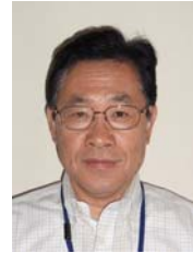
徳島県県土整備部