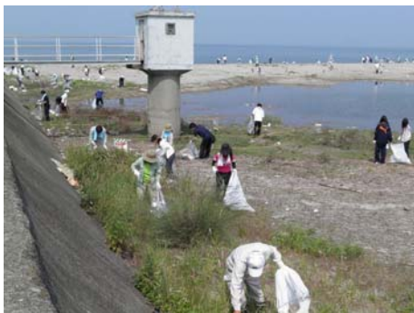
▲一生懸命にゴミを拾う参加者 ご参加ありがとうございました。

清掃は、重信川河口、重信橋周辺、拝志大橋周辺の三箇所で行われ、約三百七十名の参加がありました。