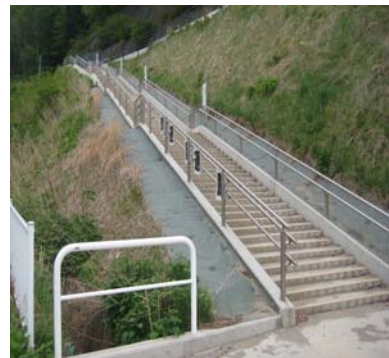
▲小本小学校の体育館裏から伸びる国道45号へ続く避難階段

津波は岩手県岩泉町小本地区にある高さ十二メートルの防潮堤を乗り越えて川をさかのぼり、家屋をのみ込みながら小学校まで迫ってきました。 間一髪で児童八十八人の危機を救ったのは、二年前に設置された百三十段の避難階段でした。