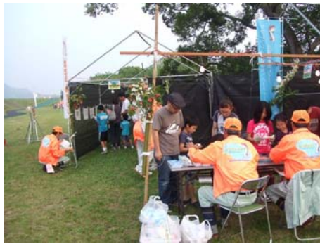
▲「ホタルの一生・魚類探検コーナー」親子でホタルについて勉強しました。

賞や生態説明と共に、土器川に生息する水生生物の展示・紹介を行う「ホタルの一生・魚類探検コーナー」や、網を張ったテントの中に放ったホタルが何匹いるかを当てるクイズ、水風船のヨーヨー吊り、楽しみながら水の循環について学ぶ体験型ゲーム、サイコロゲーム、香川県内の「水辺の八十八カ所」の紹介や、土器川の現状についてのパネル展示など、様々な催し物を行いました。