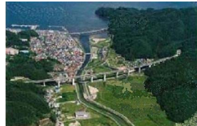
▲津波を想定して建設された三陸縦貫道

●信頼性の高い道路ネットワークの整備、高速道路が緊急輸送道路として効果を発揮します。「命の道」として救急・救援、復旧に役立った三陸縦貫道は津波を避けて計画されており、被害を受けることなく緊急輸送道路として機能しました。