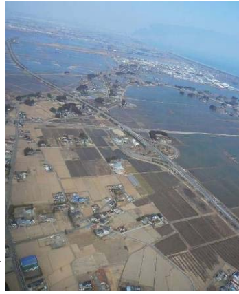
▶ 周辺より高い盛土構造の 仙台東部道路

メートル)の仙台東部道路に、約二百三十人の住民が避難しました。 また、仙台東部道路の盛土は、内陸市街地への瓦礫の流入を抑制しました。