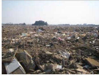
▲被害の大きかった海側