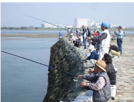
▲いっぱい釣れたよ。 セイゴやアジも釣れたよ。

大会参加者は、昨年より四十名ほど多い、約四百九十名でした。当日は、絶好の釣り日和となり、開会を待ちかねた参加家族らは、吉野川に架かる名田橋から河口までの間に散って行きました。また、釣りの合間に河川敷の清掃にも参加していただき、エコな釣り大会となりました。