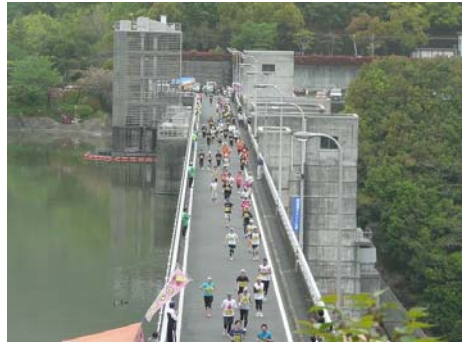
▲ダム堤体天端を走るランナー 景色も楽しみながら走りました。

また、地元野村中学校より、給水等のボランティアに約百五十名が参加し、大会を一層盛り上げました。