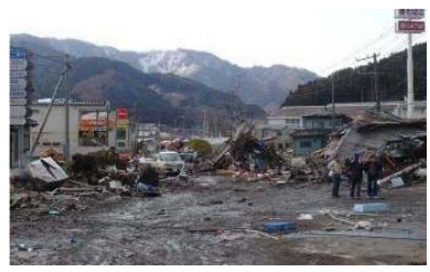
▲被災直後(国道45号釜石市)