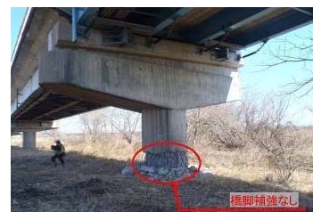
▲耐震補強なしの橋脚