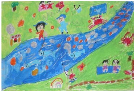
▲優秀作品のうちの一つ きれいな川で楽しそうですね。

そのイベントの一環として、吉野川沿いの小学校の児童を対象に、「よりよい吉野川・銅山川」をテーマとした図画を募集し、七月二十二日(金)、高知県土佐町にある早明浦ダムふれあいホールにおいて入賞作品の表彰式を行いました。