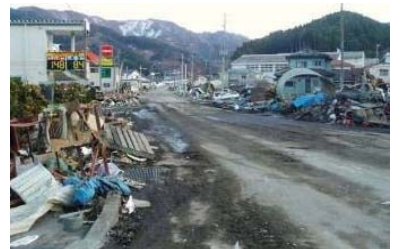
▲2車線交通路確保 (3月12日撮影)

●信頼性の高い道路ネットワークの整備、高速道路が緊急輸送道路として効果を発揮します。「命の道」として救急・救援、復旧に役立った三陸縦貫道は津波を避けて計画されており、被害を受けることなく緊急輸送道路として機能しました。