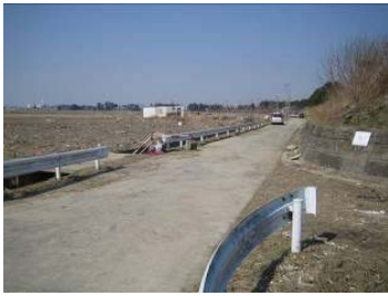
▲被害の少なかった陸側